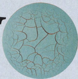
(左) Monocromo Celadon Redondo, 2015

單色青釉為瓷器最早的顏色釉，Varejão鍾情於其中裂紋，與西方油畫上的裂紋如出一轍。